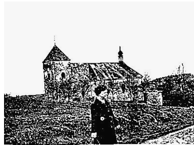
obr.5: pohled na kostel z jihu z roku 1972 je patrný rozpad v prostoru márnice