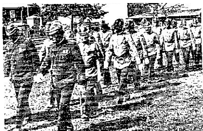
obr.8: dobrovolný pož. spolek

rychnovský školní spolek, byl založen po prv. svět. válce, relativně malé příspěvky stačily aby mohly být učebnice a učební pomůcky pořizovány z velkoobchodu levněji, každé čtvrté dítě v rodině bylo od příspěvků osvobozeno. Učebnice byly opatřeny ochr. obaly za účelem delší životnosti, každý rok se pořádal školní bál a čistý výtěžek byl připisován na účet školního spolku.